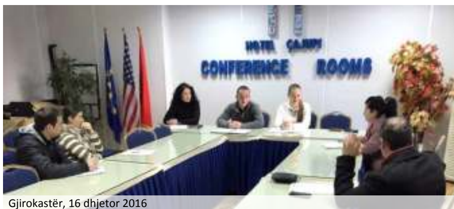
Gjirokastrë, 16 dhjetor 2016