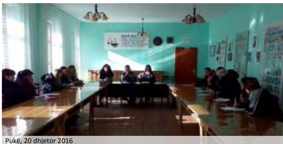
Pukë, 20 dhjetor 2016