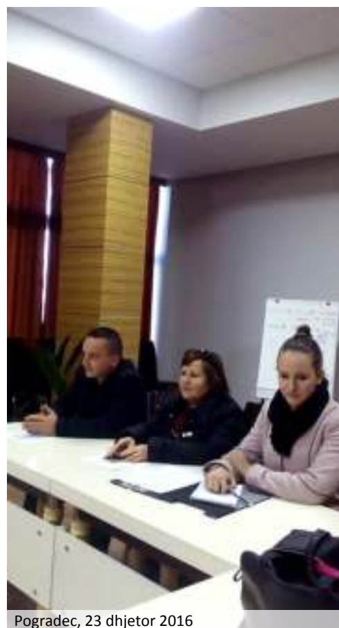
Pogradec, 23 dhjetor 2016