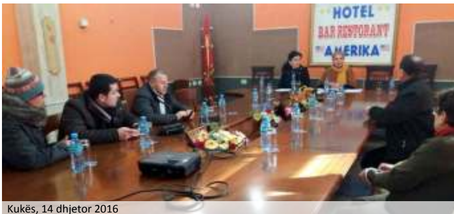
Kukës, 14 dhjetor 2016

Këto takimet konsultative u zhvilluan në qytetet: Kukës, Gjirokastrë, Pukë dhe Pogradec, përkatësisht në datat 14, 16, 20 dhe 23 dhjetor 2016.