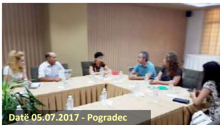
Datë 05.07.2017 - Pogradec

Përgjatë muajit qershor janë mbajtur dy takime konsultative, e para më datë 22 qershor 2017 në qytetin e Kukësit dhe më 29 qershor 2017 në qytetin e Gjirokastrës, ndërsa takimet e radhës u mbajtën më datë 5 korrik 2017 në qytetin e Pogradecit dhe takimi përfundimtar më 15 korrik 2017 në Tiranë.