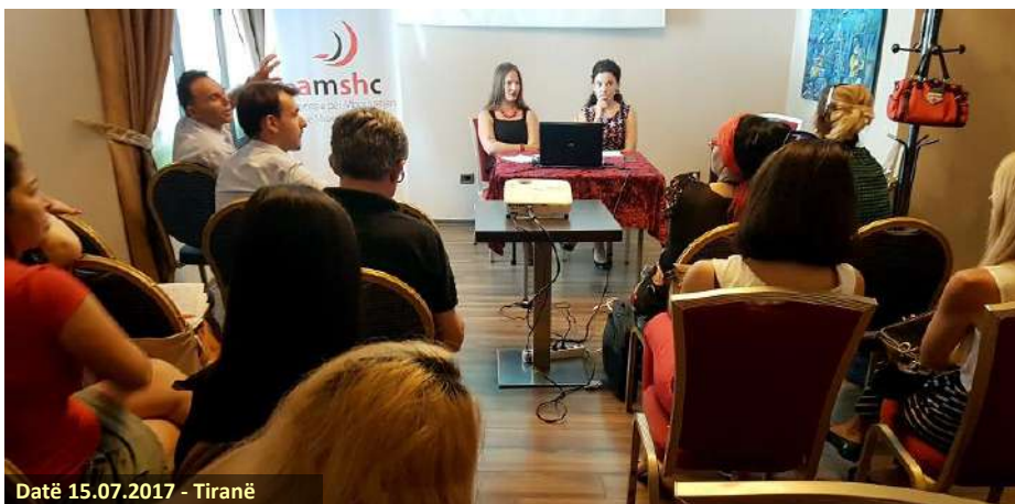
Datë 15.07.2017 - Tiranë