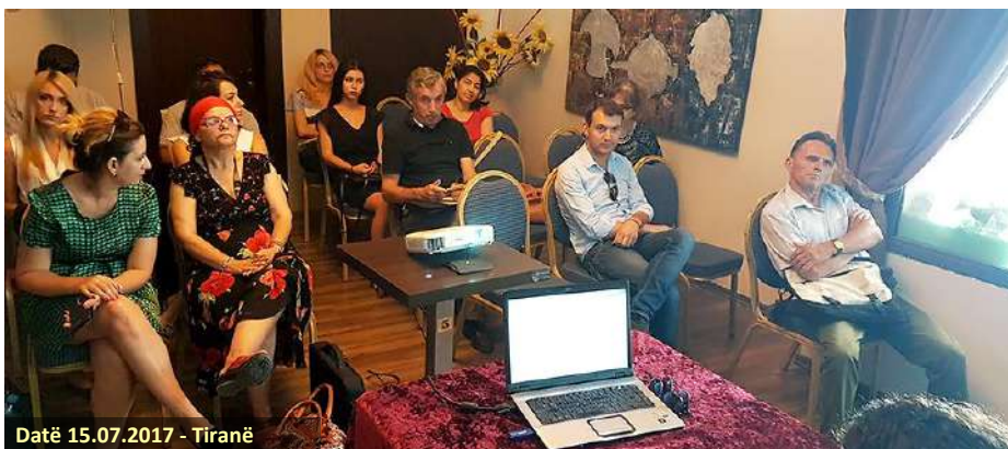
Datë 15.07.2017 - Tiranë