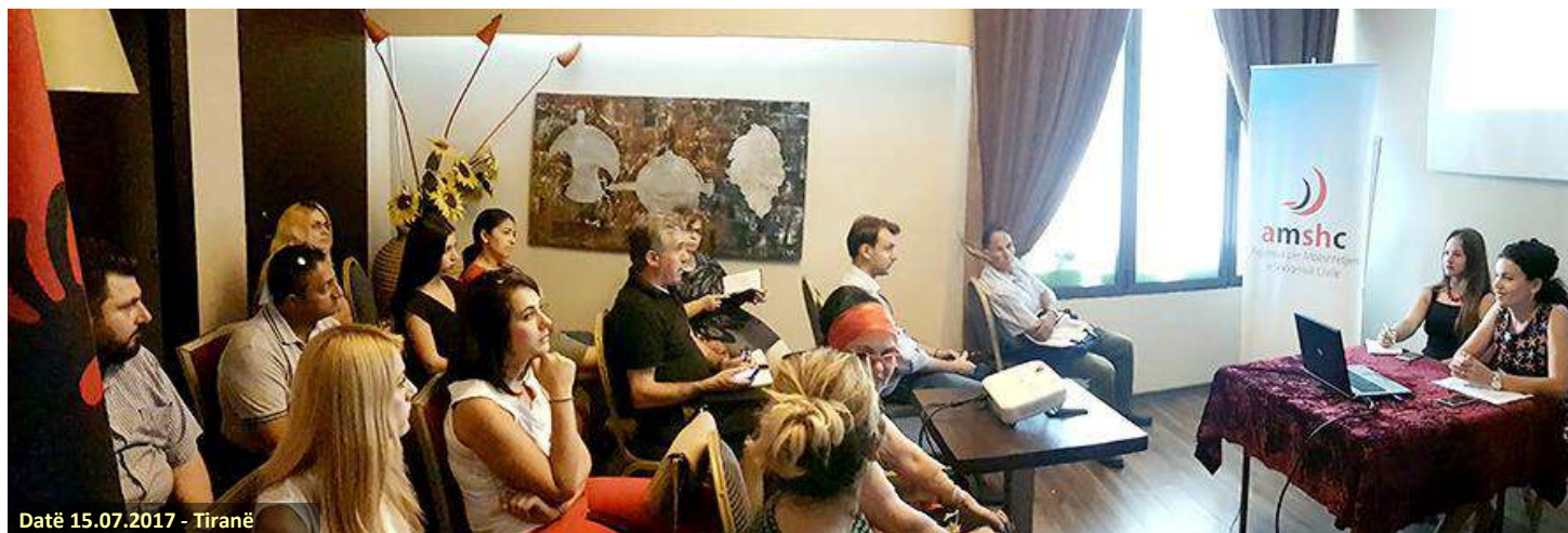
Datë 15.07.2017 - Tiranë