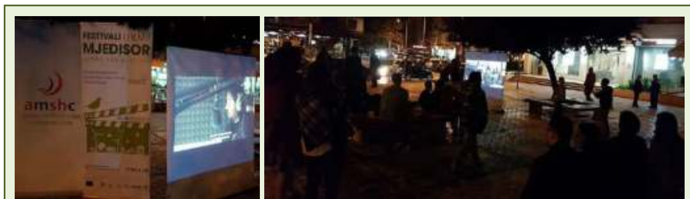
25 tetor 2017 – Shfaqja e filmit “La grande monnezza - Life by the land eld”, në sheshin “Shtraus” – Tiranë

Për shpërndarje më mirë të qëllimit të festivalit edhe me komunitetin lokal, gjatë këtyre ditëve, në datat 25, 26 dhe 27 tetor 2017 edhe Agjencia për Mbështetjen e Shoqërisë Civile (AMSHC) transmetoi në mbrëmje për publikun filmat e përzgjedhur, në sheshet “Shtraus”, “Demokracia” dhe “Garibaldi” në qytetin e Tiranës.