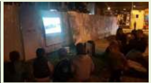
27 tetor 2017 – Shfaqja e filmit “The tortoise and the tapir”, në sheshin “Garibaldi” – Tiranë

Në mbrëmjen e datës 28 tetor 2017, në ambjentet e Qendrën Multifunkionale “TEN”, u organiza mbyllja e festivalit dhe ndarja e çmimeve për filmat më të mirë: