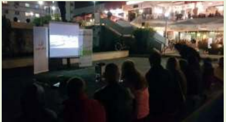
26 tetor 2017 – Shfaqja e filmit “Eat, Grow, Love”, në sheshin “Demokracia”, Qyteti Studenti – Tiranë